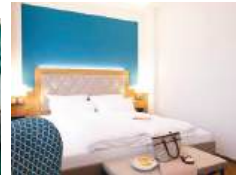
Hotel Ross Inh. Hotel Ross Meissen Betriebsgesellschaft mbH & Co. KG

Stilvolles Hotel im Herzen der historischen Altstadt Meißen mit Blick auf das malerische Tuchmacherort. Alle Zimmer bieten gehobenen Standard, Zimmersafe und Sat-TV. Im Journalcafé werden Snacks, Kuchen, Eis, Tee- und Kaffeespezialitäten angeboten. Ein hoteleigener Parkplatz befindet sich 250m entfernt.