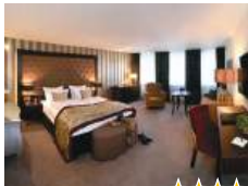
Romantik Hotel Burgkeller Residenz Kerstinghaus Inh. GfH Burgkeller GmbH

Domplatz 11, 01662 Meißen T 03521 41400 info@hotel-burgkeller-meissen.de www.burgkeller-meissen.de