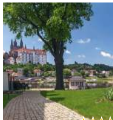
Dorint Parkhotel Meißen Inh. Dorint GmbH

Das traditionsreiche Hotel liegt nur wenige Schritte vom Markt entfernt, eingebettet im Kern der Altstadt von Meißen. Hier können Sie alle Annehmlichkeiten eines modernen Hotels genießen, verbunden mit stilvoller Eleganz und Liebe zum Detail. Im Restaurant „Zum Löwen“ oder im Eventlokal „Zum Speicher“ bieten wir kulinarische Köstlichkeiten und Weine der Region. Der Veranstaltungsraum bietet Platz für Seminare und Feiern. Ein öffentlicher Parkplatz befindet sich unmittelbar vor dem Hotel. (Adresse Navigation: Kleinmark 3) Der hoteleigene Parkplatz ist 250 m entfernt.