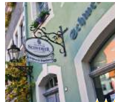
Schwanke Schankhaus & Hotel Inh. Privatbrauerei Schwanke Meißen GmbH

Genießen Sie den 4-Sterne Superior Komfort im Dorint Parkhotel Meißen, malerisch gelegen am Elbufer mit Blick auf die Albrechtsburg und den Dom. Im Restaurant Ohm's mit Wintergarten können Sie sich von der regionalen Küche verwöhnen lassen. Im Anschluss können Sie den Abend in der Garden Lounge oder auf der Terrasse gemütlich ausklingen lassen. Entspannung finden Sie im Veduta Spa in der finnischen Sauna, in der einzigartigen Panoramasauna, im Dampfbad oder bei einer Massage. Wir haben in jedem Zimmer einen kleinen Kühlschrank. Getränke können 24 Stunden an der Rezeption gekauft werden.