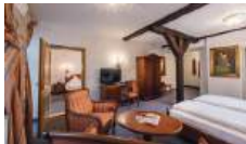
Hotel „Goldener Löwe“ Inh. Hotel Goldener Löwe Betriebsgesellschaft in Meißen mbH & Co. KG

Genießen Sie, nur wenige Schritte von der Albrechtsburg und dem Meißner Dom entfernt, in unserem ehemals königlich-sächsischen Burgkeller eine einmalige Aussicht über die historische Altstadt der Wein- und Porzellanstadt Meißen. Ob in unseren gemütlichen Hotelzimmern, in unserem Panoramaristorant mit Terrasse, der Bar oder im Wellnessbereich – lassen Sie Ihren Aufenthalt in Meißen in unserem Haus zu einem ganz besonderen Erlebnis werden.