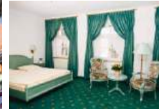
Hotel & Café „Am Markt Residenz“ Inh. Hotel Goldener Löwe Betriebsgesellschaft in Meißen mbH & Co. KG

Gastlichkeit gehört zum Braugewerbe wie der Hopfen zum Bier. Deshalb betreibt die Schwanke Brauerei das Schwanke Schankhaus & Hotel direkt am Meißner Markt. Nur wenige Schritte entfernt vom historischen Gründungsort der Brauerei, am Meißner Tuchmacherort, begrüßen wir unsere Gäste in einem denkmalgeschützten Schmuckstück aus dem 17. Jahrhundert. Seien Sie unser Gast und lassen Sie sich von uns verwöhnen.